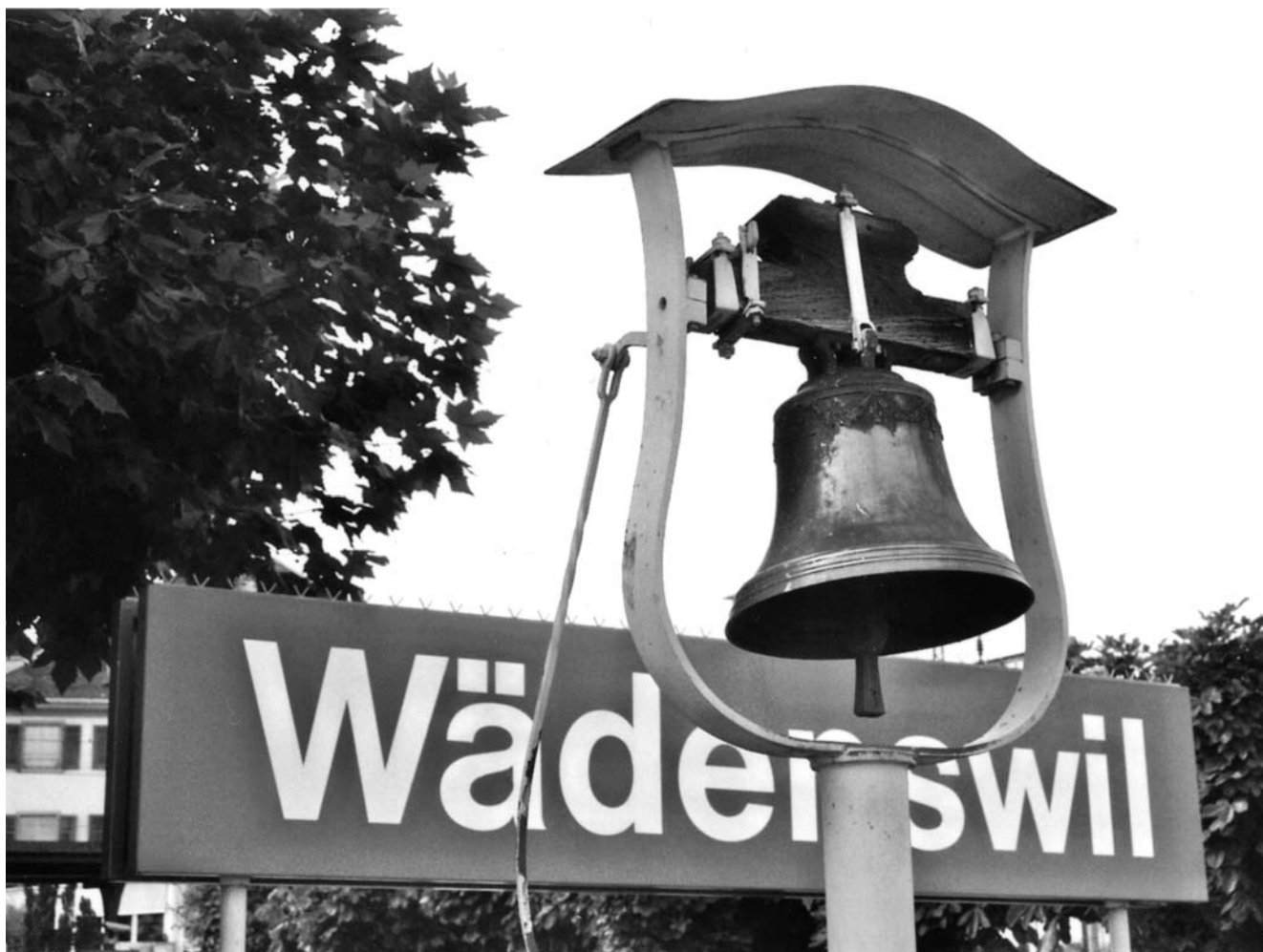
Glocke bei der Schiffsanlegestelle.